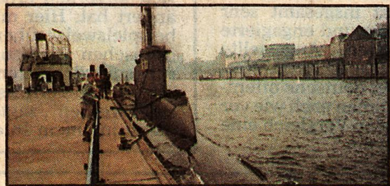
Das U-Boot aus Eckernförde hat heute früh Hamburg wieder verlassen

E in ungewöhnliches Hamburg-Bild – der Michel im Sehrohr eines U-Bootes. Am Montag lief die U 23 der Bundesmarine im Hamburger Hafen ein und machte an der Überseebrücke fest. Jochen Körner, Fotoreporter des Abendblattes, ging an Bord und